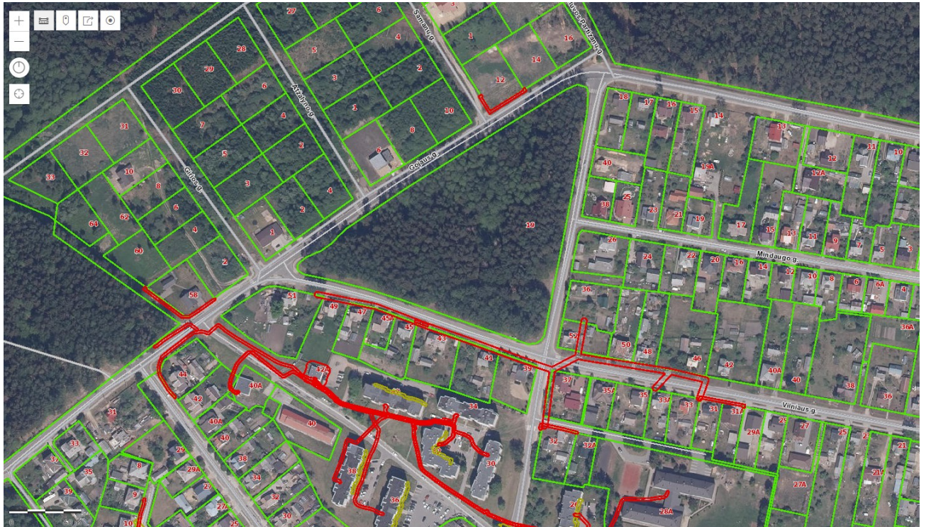
Projekto vietovės ortofoto nuotrauka. Šaltinis: Registrų centras, portalas regia.lt , 2021