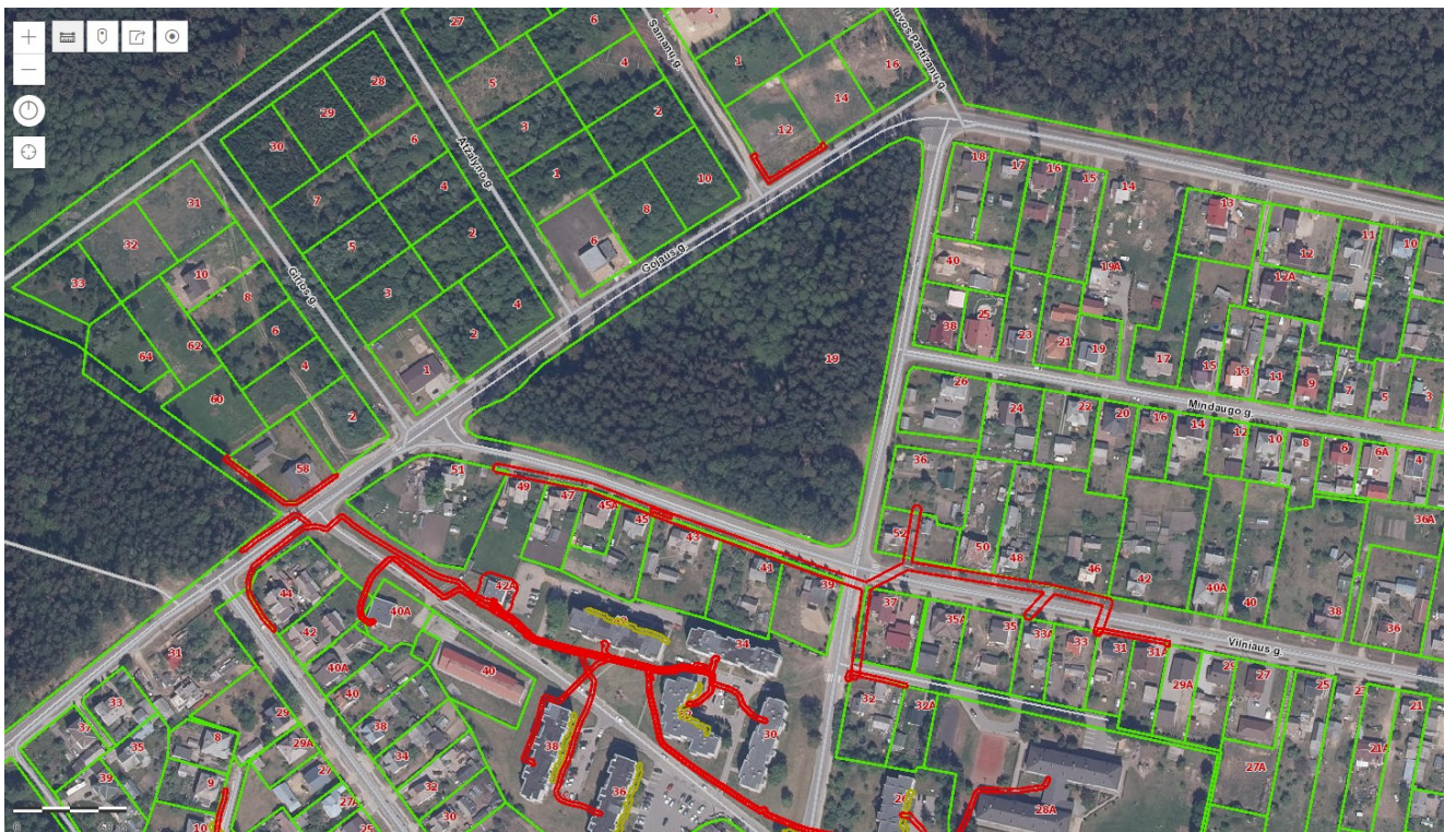
Š26 sklypo, kuriame kuriamas parkas, padėtis miesto šiaurinės dalies kadastro žemėlapyje.